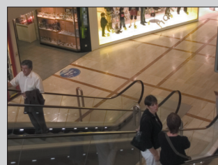
Image large à 2,8 mm. C'est le plus grand angle de sa catégorie pour éviter les angles morts.